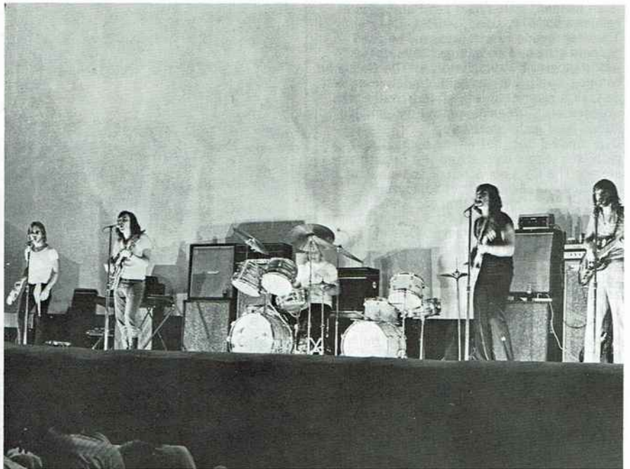
The Cats speelden in de West voor uitverkochte zalen. Hier twee foto's tijdens een optreden in Paramaribo.