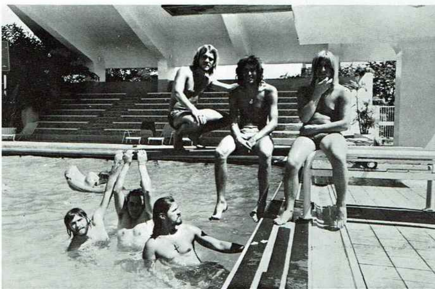
Tijdens de trip door de West hadden The Cats ook ruimschoots de gelegenheid om een duik in een zwembad te nemen.