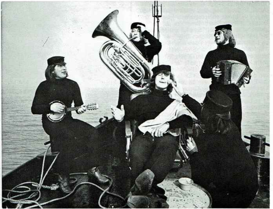
De opname van de TV-film "Colour us gold". Tijdens deze leuke scene speelden The Cats op de achtergrond natuurlijk "Shaving cream"!

weer zo'n inspanning aan de dag legde. In de tuin rijk voorzien van gigantische muziekzuilen, die een imposant lawaai uitbraakten, zagen The Cats kans om het gehele gehoor vooral tijdens hun tweede optreden volledig aan hun hooggehakte voeten te krijgen. Foto's, handtekeningen en platen die inderhaast waren aangedragen om ook daar de naam van de mannen in kwestie op te laten zetten, waren een gewild artikel. Het succes van de Volendamers was volmaakt. Zondagmorgen reisden